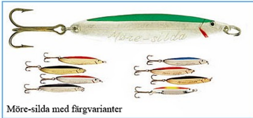
Möre-silda med färgvarianter