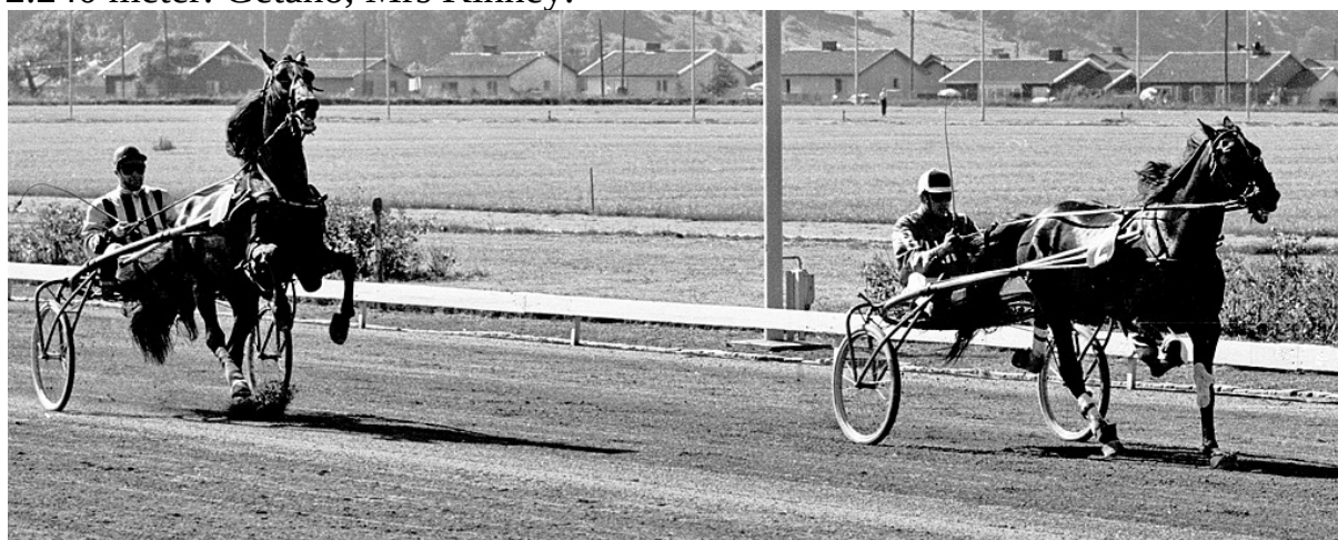
Junker vinner Kungapokalen 1961 överlägset sedan Gay Boy galopperat