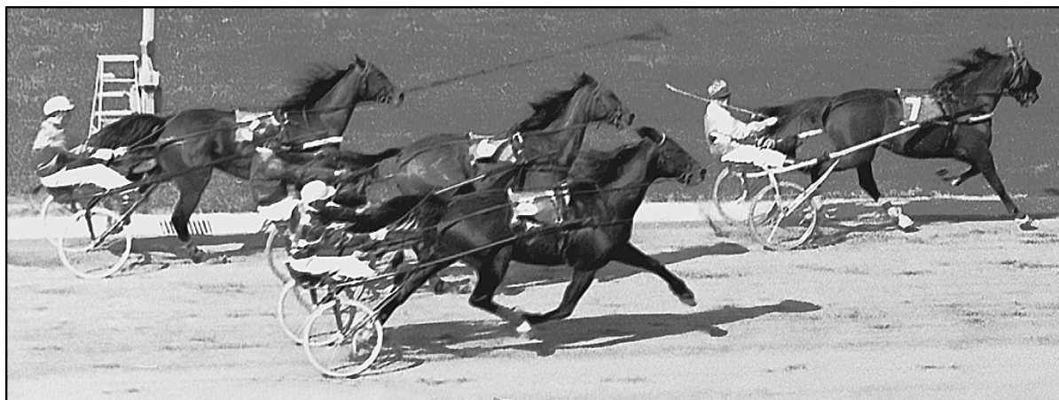
Eileen Eden på väg mot segern i Elitloppets andra avdelning 1968. Kentucky Fibber spurtar till sig en klar andraplats före Thètis IV och invändige Coalition.