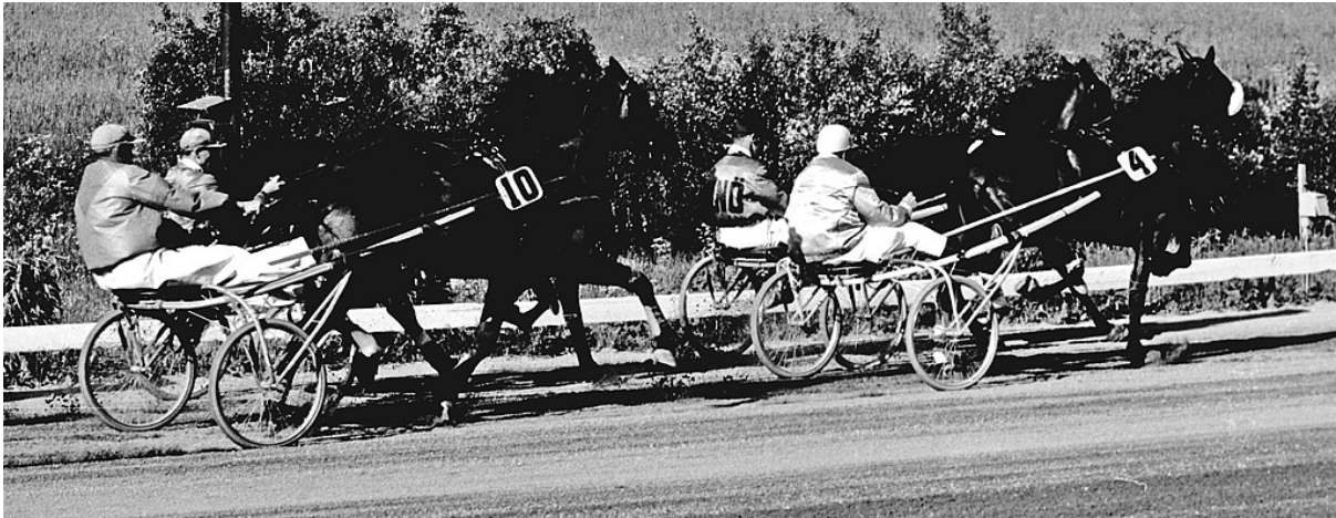
Loconey leder andra heatet av Bersåkers St. Heatlopp före Quite medan Jarl Fafner (10) avvaktar i andrapar utvändigt