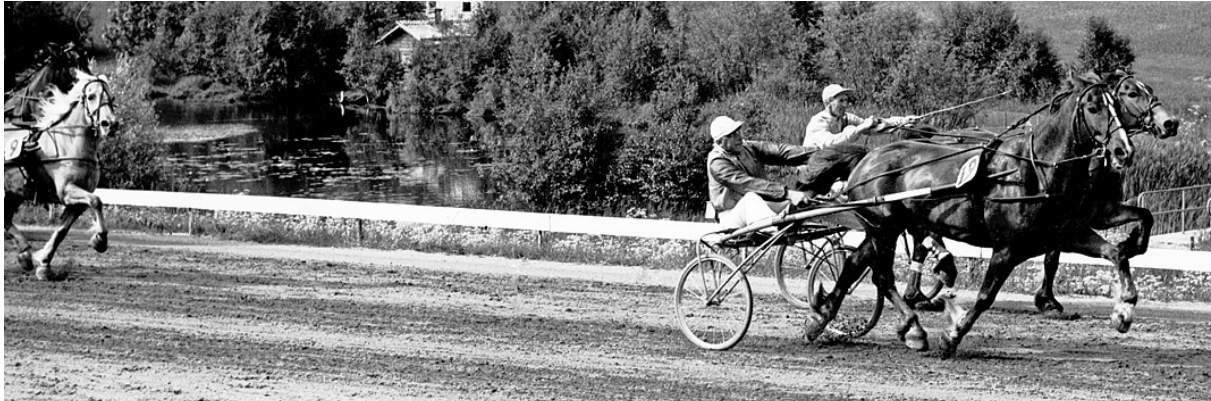
Plurus vinner snabbloppet på Bergåker (25/6, 1961) före Bickel och Solsticka