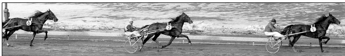
Vårpokalen, Solvalla 7 april 1963: Puck Star drar hårt före Tamborito och Locotime