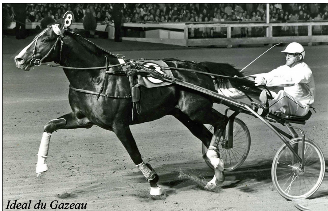
Ideal du Gazeau