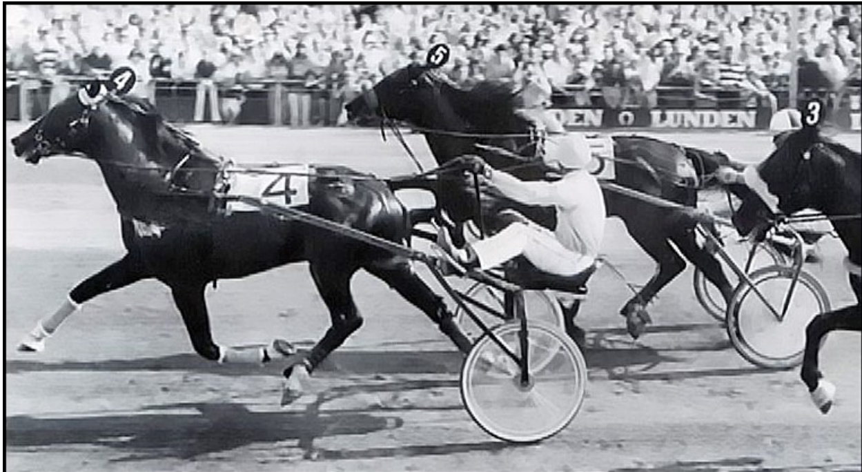
Ideal du Gazeau vinner Copenhagen Cup 1980 före My Nevele och Express Gaxe.