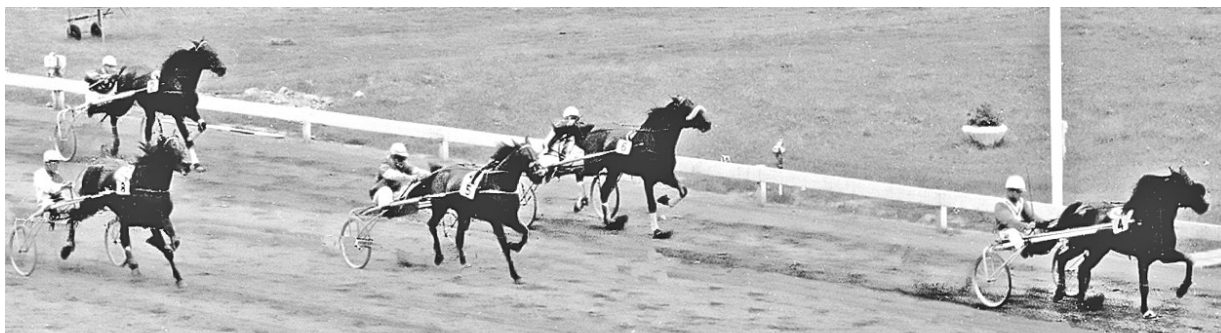
Princess Cleo vinner avd I av Septemberpokalen på Örebro den 22 sept. 1963 före Unda Frisco (5), Friherren (6) och Sorina (längst till vänster).

Två utslagningslopp över 2100 meter och en final över sprinterdistans, bägge med ett tillägg, var förutsättningarna när Örebro avverkade Septemberpokalen 1963. Förstaprisen uppgick till 1 200 respektive 3 000 kronor.