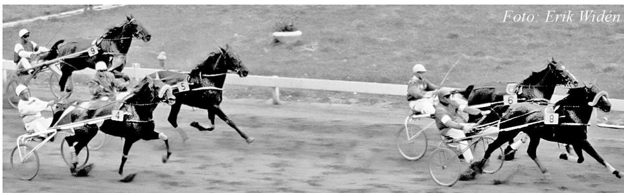
Max Iran vinner avd. II av Septemberpokalen på Örebro den 22 sept. 1963 före Oranta Day, Iduna (4), Flying Scotch (5) och Mr Allan (9).