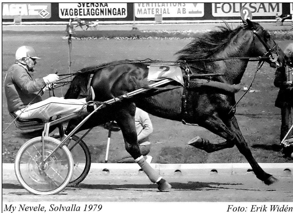
My Nevele, Solvalla 1979