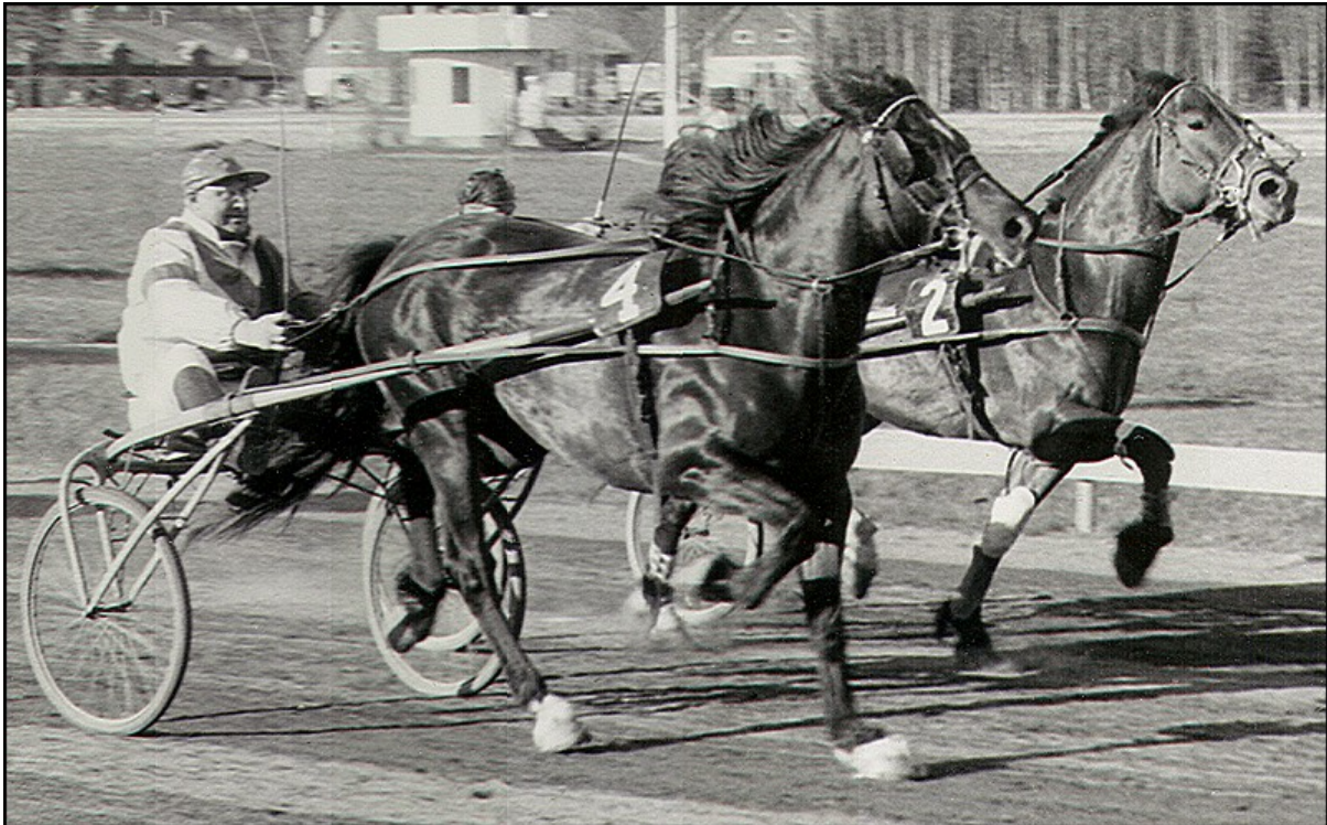
Pålmi slår Tilja. Östersund 20/5 1961.

Pålmi fick endast två föl, av vilka ett startade, Bauspål (e. Bausgutt) som noterade 34,4ak och skrapade ihop 31 600 SEK.