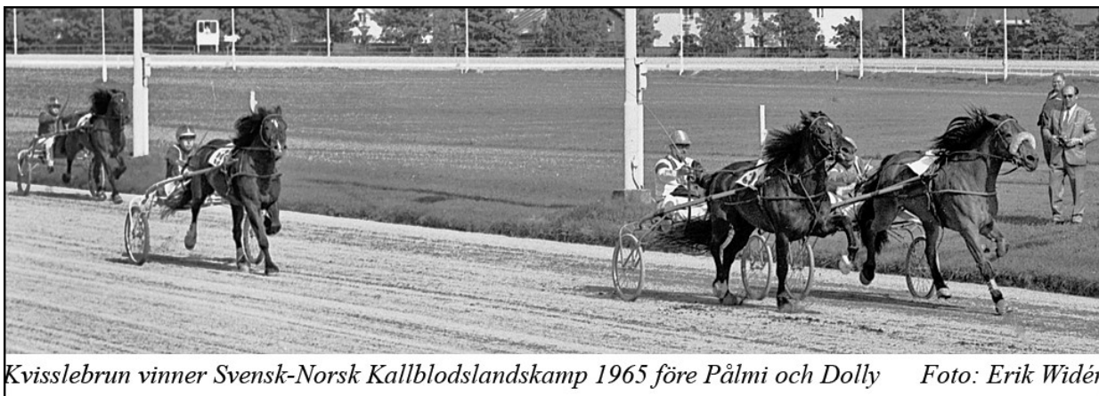
Kvisslebrun vinner Svensk-Norsk Kallblodslandskamp 1965 före Pålmi och Dolly