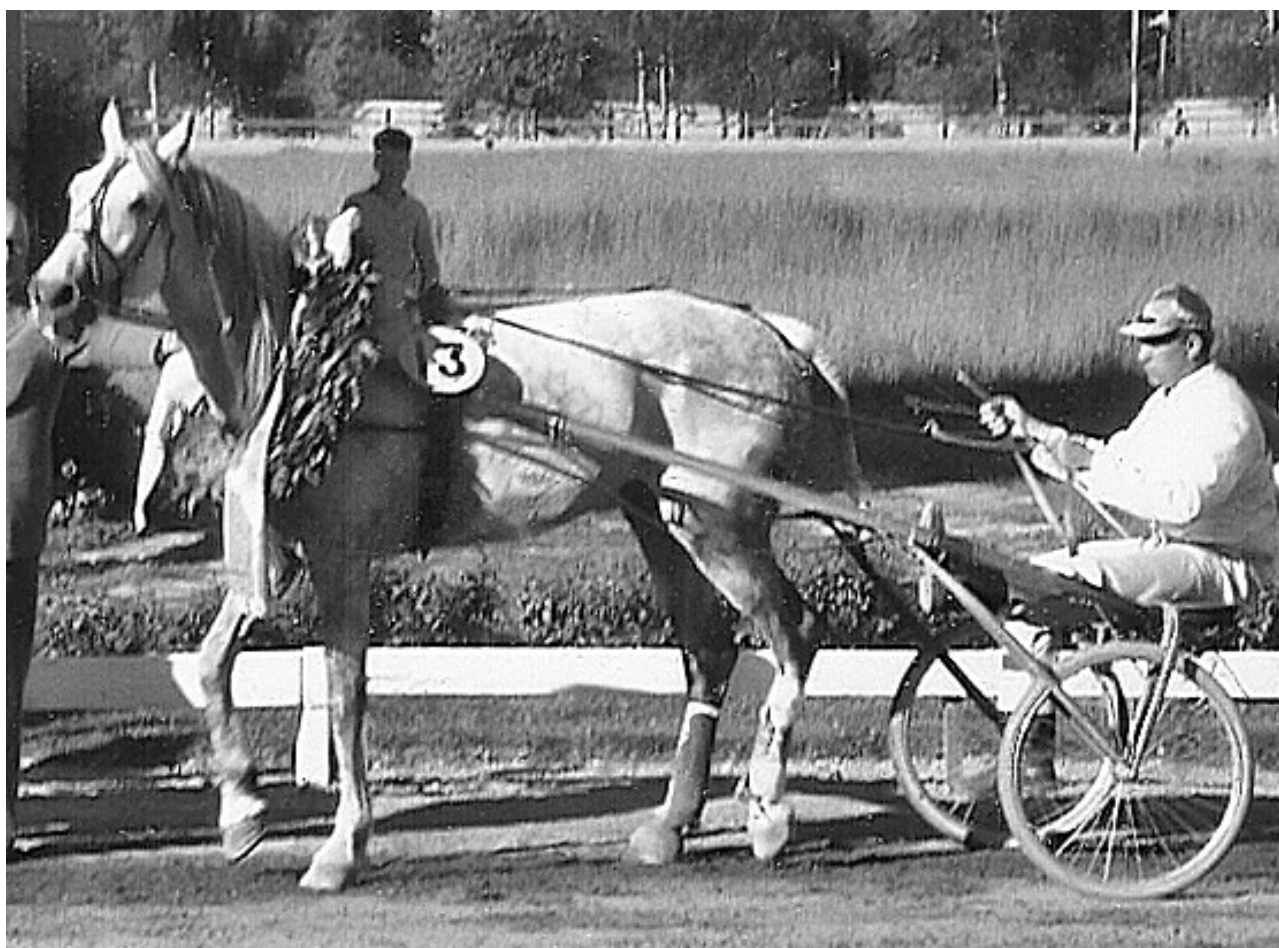
Pichta efter segern i Färjestads Jubileumslopp 1959

Orlovtravaren är en hästras som härstammar från Ryssland. Rasen finns numera av tre typer, en tyngre körhäst, den lättare travaren och den medelstora ridhästen. Orlovtravaren har i regel en proportionerlig exteriör med långa och slanka, men starka ben. Fram till 50-talet kunde orlovtravaren hävda sig väl på travovalerna, men numera dominerar franska och amerikanska hästar och korsningar dem emellan.