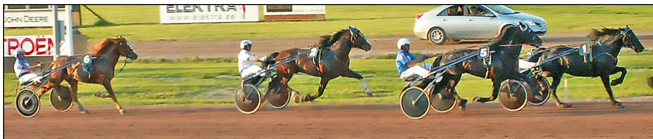
Faksen J:r leder Prinsessan Madeleines Pokal när ett varv återstår före Slått Eld, Lungutten och Keik Jo. Bollnäs 4/7 06.