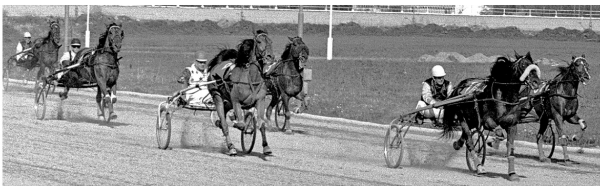
Prenat vinner Pingstpokalen före Arctic Laylock och invändige Bell Noon.