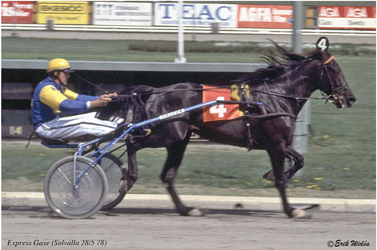
Express Gaxe (Solvalla 2815 78)