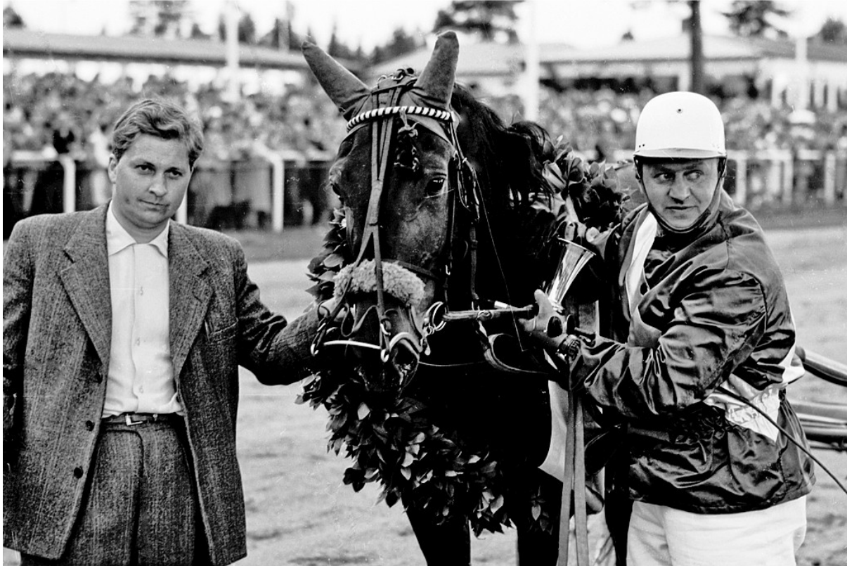
Pavinblända efter segern i Östersunds Stora 4-åringslopp 1961