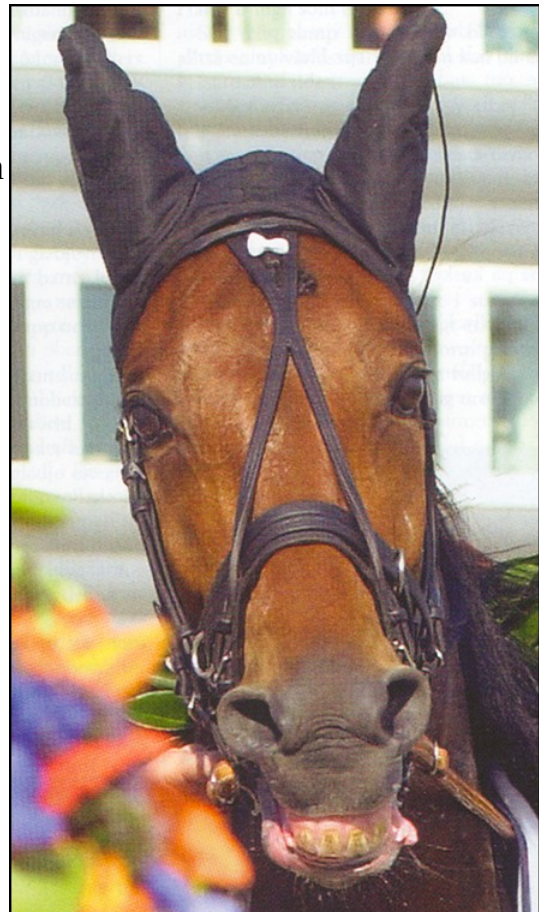
Victory Tilly

Misti Iran blev mor till Micko Tilly (e. Frances Nibs), vilken redan som unghäst visade sina stora talanger. Micko Tilly fick visserligen stryk av Grain i kriteriet efter att ha fått göra grovjobbet, men utvecklades sedan till en världsstjärna